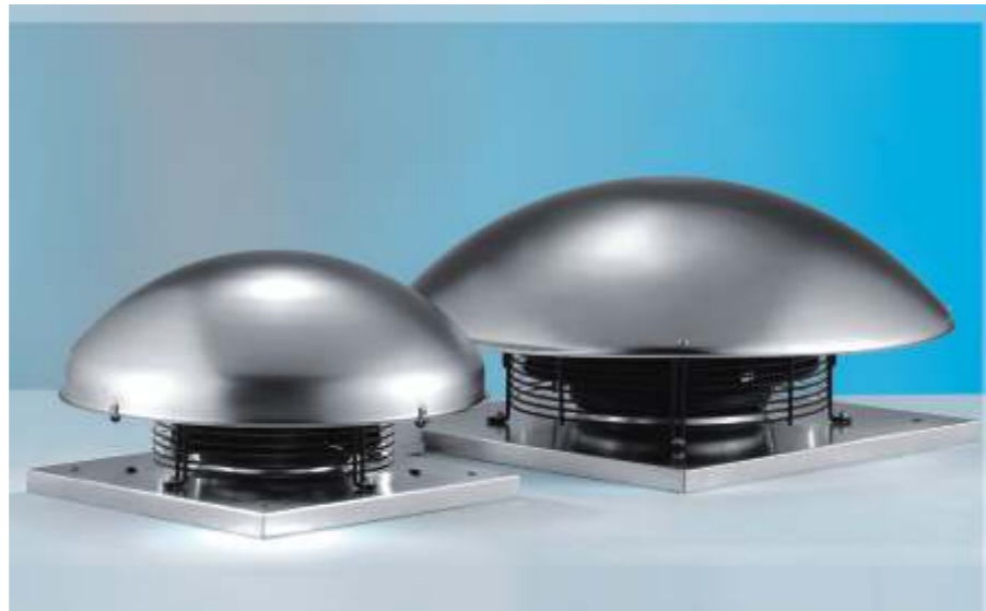
WD II radiální střešní ventilátor

WK II Ø150 - pozink WK II Ø200 - pozink WK II Ø250 - pozink WK II Ø315 - pozink