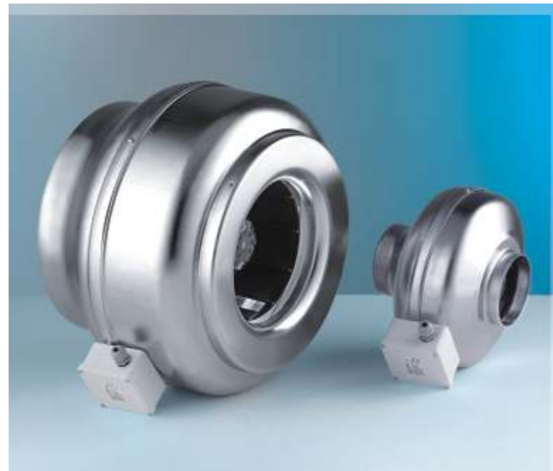
WK radiální ventilátor

Dodávané průměry : Ø100, Ø125, Ø150, Ø160 Ø200, Ø250, Ø315